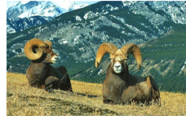
Tjockhornsfår i kanadensiska delen av Klippiga bergen.