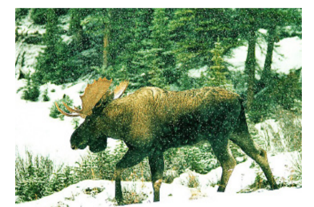
Älgjur. Älgen är det största nu levande hjortdjuret.