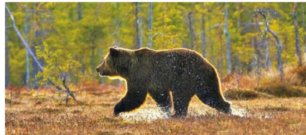
Hälle Flygare har även hunnit med att fotografera den nordiska naturen. Här en brunbjörn i Finland.