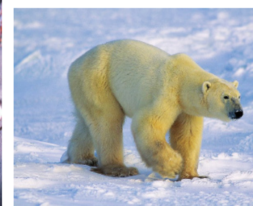
Isbjörn vid Hudson Bay, Kanada.